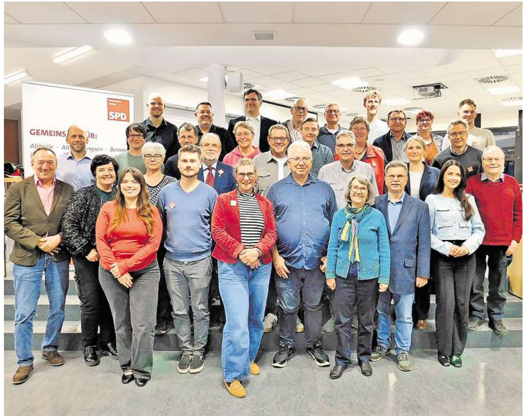
Die SPD Uetze hat ihre Kandidatinnen und Kandidaten für die Kommunalwahl aufgestellt.