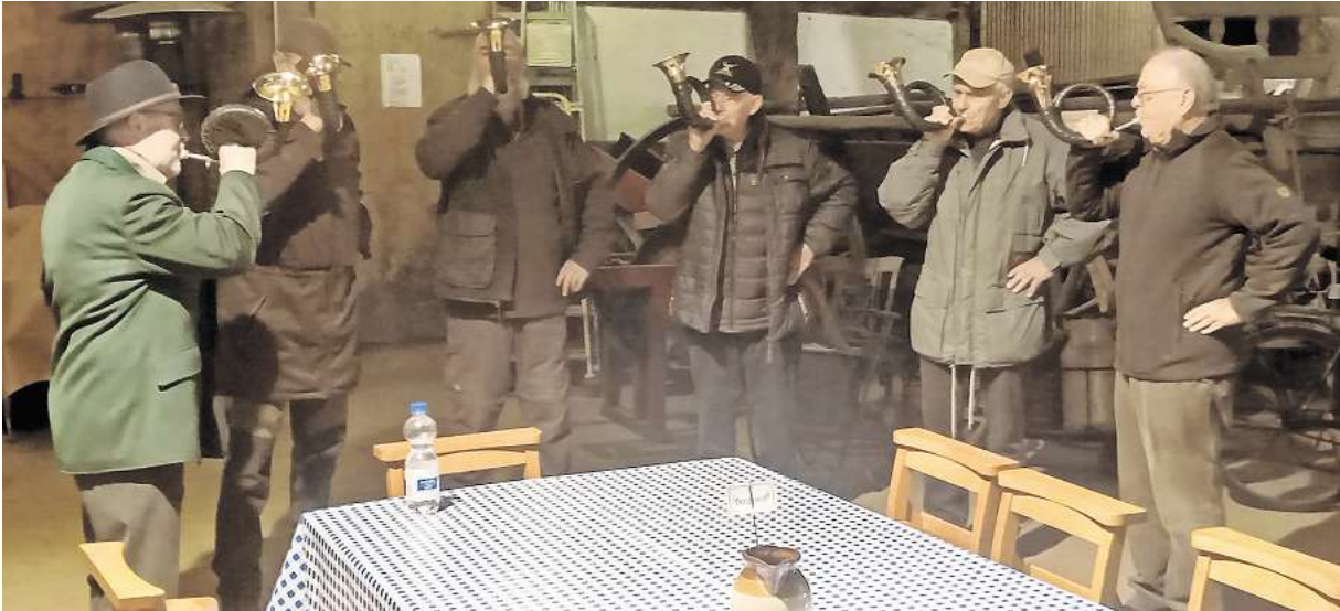
Jagdhornbläser sind erstmals beim Saisonauftakt im Zweiständerhaus in Wackerwinkel zu Gast.

Rund 100 Gäste beim Saisonstart im Zweiständerhaus in Wackerwinkel