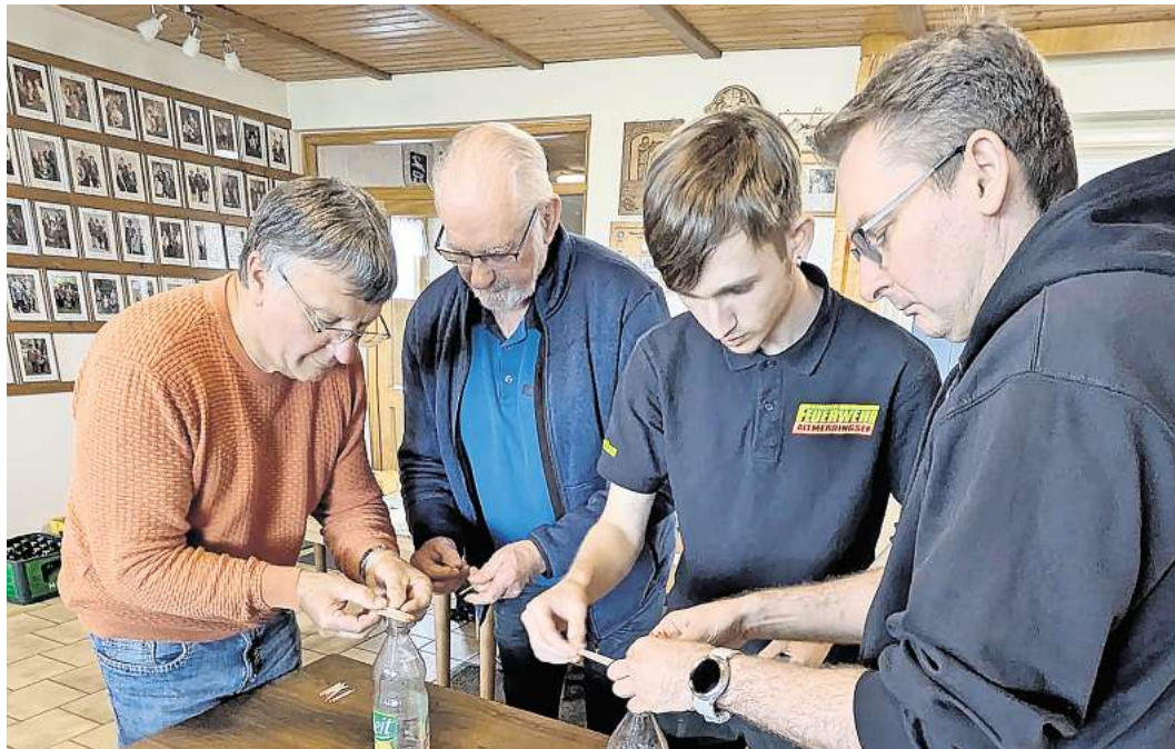
Bei einem der Spiele gilt es, Nägel auf einem Flaschenhals zu stapeln.

Freundschaftswettkampf zwischen Schützenverein und Feuerwehr mit Spielen wie beim Kindergeburtstag