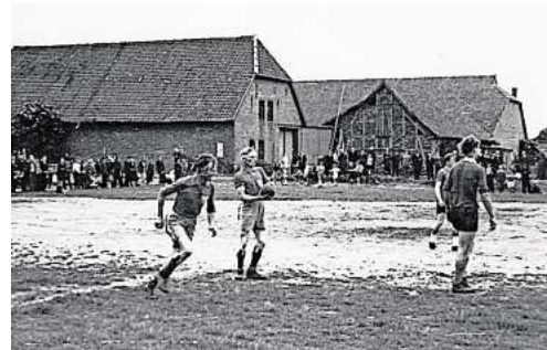
Das Foto zeigt eine Spielszene im Jahr 1946 auf dem Sportplatz in Hänigsen.

Die vielen Erinnerungen, Anekdoten und persönlichen Einblicke verleihen der Chronik einen besonderen Wert. Sie zeigen, dass es im Vereinsleben nie allein um Ergebnisse ging, sondern immer auch um Gemeinschaft.