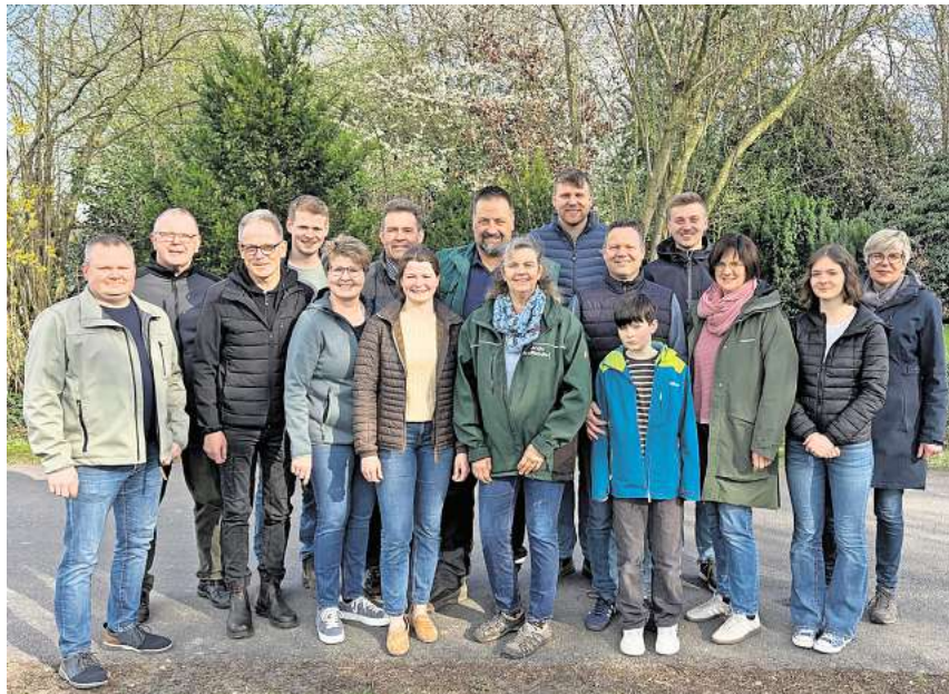
In Schwüblingsen beteiligen sich Landwirtinnen und Landwirte von vier Betrieben am Tag des offenen Hofes.

Schnäppchen und Raritäten können Besucher beim Flohmarkt in Eltze entdecken. Er öffnet am Sonntag, 31. Mai, von 10 bis 15 Uhr auf dem Veranstaltungsgelände auf dem „Alten Bahndamm“. Organisiert wird der Flohmarkt vom Molle Veranstaltungsservice.