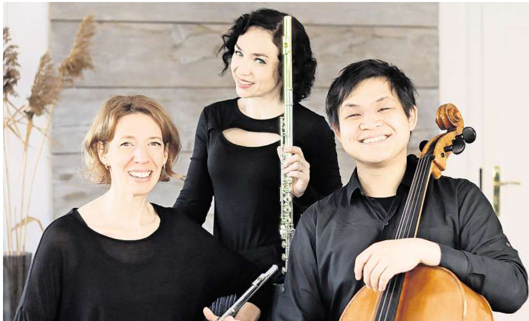
Das Trio Brioso setzt auf stilistische Vielfalt und möchte bekannte Werke neu erlebbar machen.

Die beiden erfahrenen Musiker touren seit vielen Jahren durch Deutschland und möchten mit ihrer Musik vor allem eines verbreiten: gute Laune. Ihre Konzerte gelten als leicht, humorvoll und zugleich atmosphärisch dicht. Zwischen den Liedern entstehen immer wieder kleine philosophische