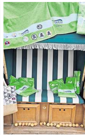
Freibad-Feeling mit Strandkorb und Batze-Laken.