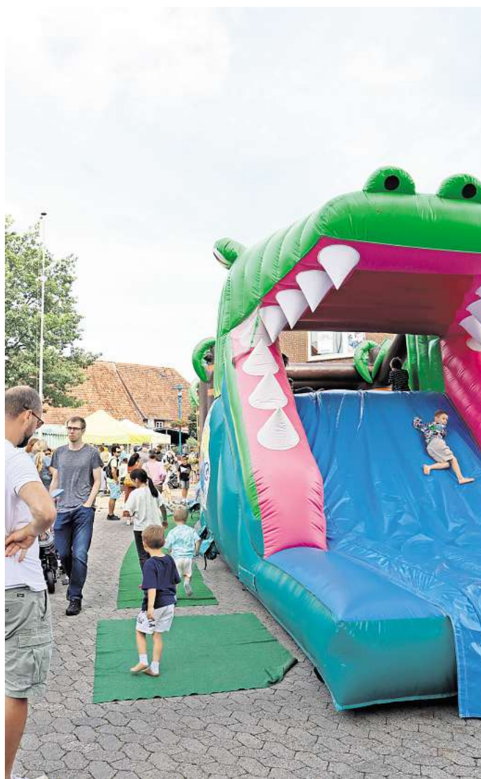
Die Kinder können sich wieder auf einer Hüpfburg austoben.

Darüber hinaus beteiligen sich auch wieder viele Vereine und Einrichtungen an dem umfangreichen Kinderprogramm am Sonntag, 8. September. Der Waldkindergarten Uetze ist mit den Grashüpfern und der Krippe Fuhseströche dabei. Sein Stand wird auf Höhe von La Rocca stehen. Dort gibt es einen Bücherflohmarkt, bei dem der Erlös für neue Spiel- und Lernmaterialien verwendet wird.