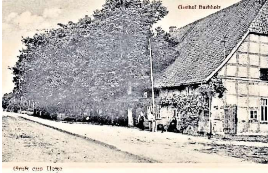
Der Heimatbund bewahrt unter anderem historische Aufnahmen von Uetze.

Bei den Dorfführungen des Heimatbunds ändern sich immer die Routen. Die Strecke führt diesmal vom Hindenburgplatz über die Burgdorfer Straße, die Seiler-, die Bente-, die Brunnen- und die Lange Straße zur Kaiserstraße. Nach gut einer Stunde endet der Rundgang in der Nähe