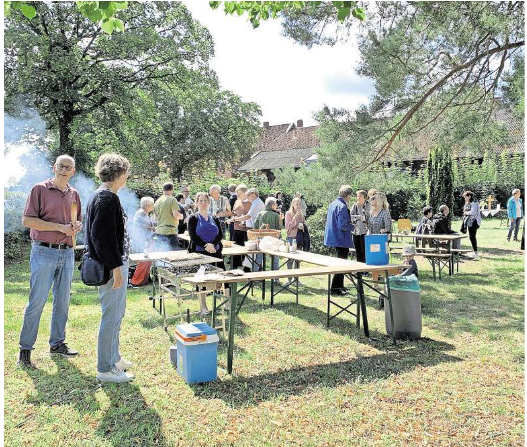
In geselliger Runde wurde der Abschluss des Friedhofsumbaus in einen Park gefeiert.

Der alte Friedhof der Kirchengemeinde in Eltze liegt mitten im Dorf. 2005 fand dort die letzte Beisetzung statt. Danach hat der Friedhof eine Reihe von Veränderungen durchlaufen. Zunächst verwilderte der Friedhof zusehends. Eine Gruppe Ehrenamtlicher aus der Kirchengemeinde begann deshalb ab 2016 den Wildwuchs zu entfernen, eine neue Hecke zu pflanzen, eine Bank aufzustellen und so den Friedhof nach und nach in einen Park umzuwandeln.