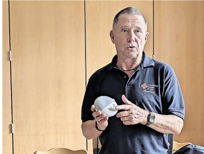
An einzelnen Beispielen wurden die unterschiedlichen Funktionen des modernen Hausnotrufs erläutert.

Knapp 20 Gäste haben die Gelegenheit wahrgenommen und sind ins Schützenhaus von Bröckel gekommen, um sich bei Kaffee und Kuchen über verschiedene Hausnotrufsysteme des DRK zu informieren. Ein Hausnotrufsystem ist nicht nur für die Betroffenen, sondern ebenso für die besorgten Angehörigen oder Freunde von großer Bedeutung. Der Bedarf einer solchen Hilfe ist, entgegen der allgemeinen Wahrnehmung, vor allem von den individu-