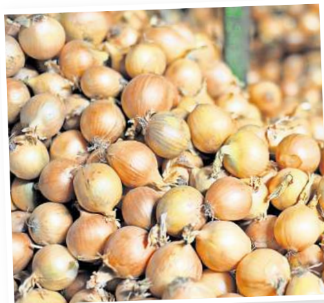
Ein norddeutsches Original: die Uetzer Zwiebel.