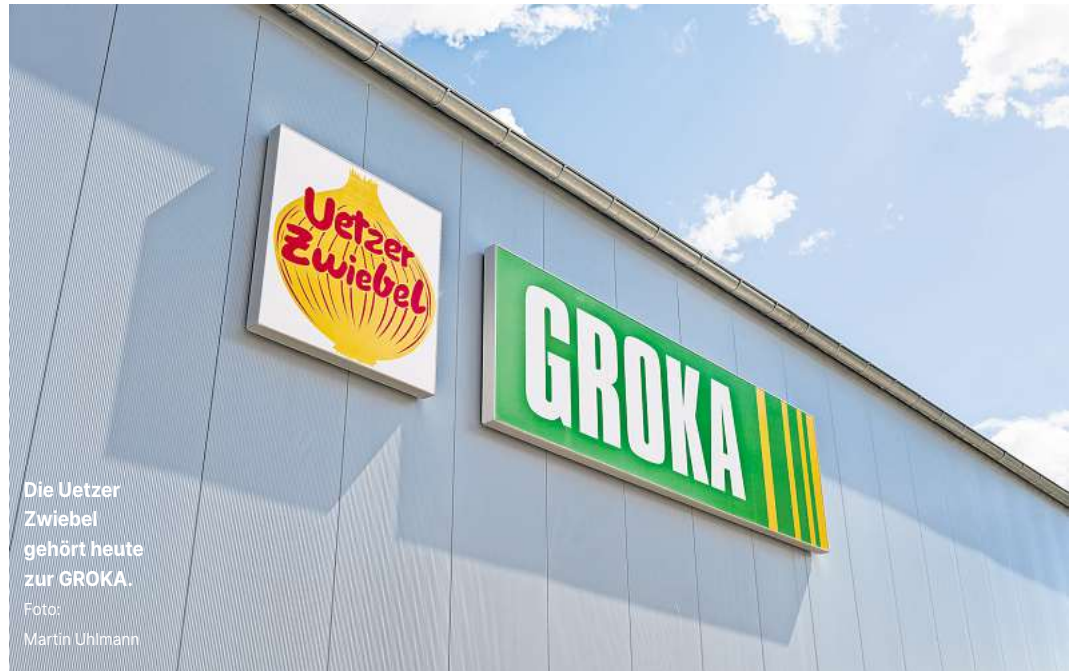
Die Uetzer Zwiebel gehört heute zur GROKA.

Ein solch großes Anbauggebiet war einmalig in Deutschland. Es