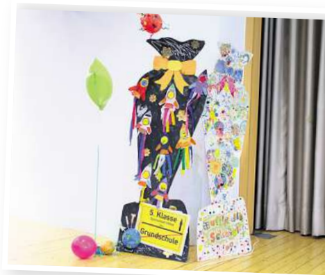
Symbolisch standen die beiden bunten Schultüten für den Abschied von der Grundschule und den Neuanfang am Gymnasium.

Ein Höhepunkt war die Ehrung der Gewinner der Rallye vom Tag der offenen Tür durch Odette Orłowski. In der Klasse 5b wurden zwei zweite Preise vergeben, und in der 5c gab es einen ersten und einen zweiten Preis. Der Förderverein sponserte für die strahlenden Gewinner T-Shirts und Hoodies der Schulkleidung.