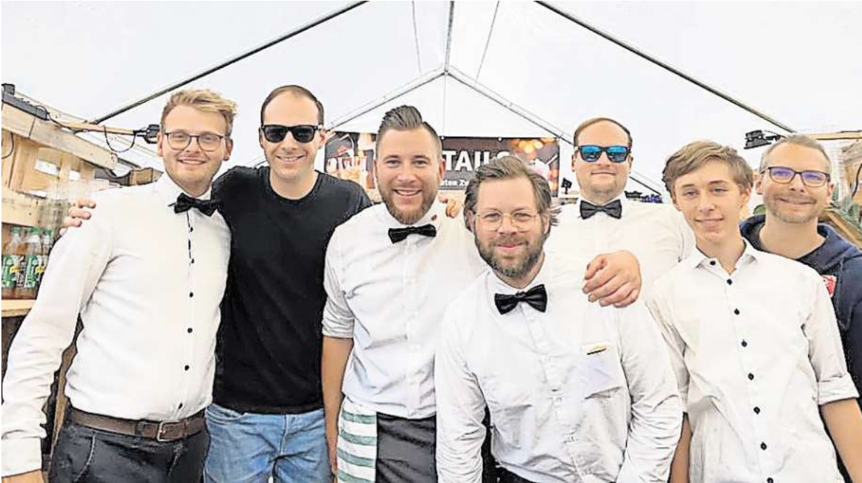
Die Mitglieder des Round Table mixen auf dem Zwiebelfest wieder Cocktails für den guten Zweck.

Round Table 77 unterstützt mit dem Erlös vom Zwiebelfest soziale Projekte für Kinder und Jugendliche