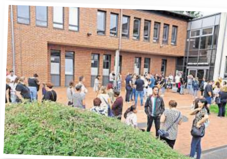
Während die Schülerinnen und Schüler ihre Stammgruppen kennenlernten, kamen die Eltern miteinander ins Gespräch.