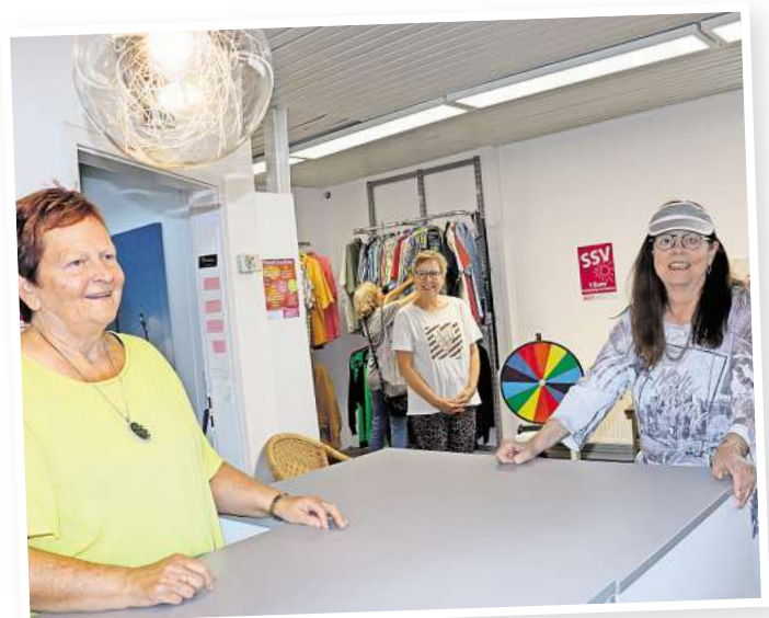
Das Team vom allerhand nUETZELiches freut sich auf das diesjährige Zwiebfest mit verkaufsoffenem Sonntag.

31311 Uetze · Gifhorner Straße 16 · info@gartenprofi.net