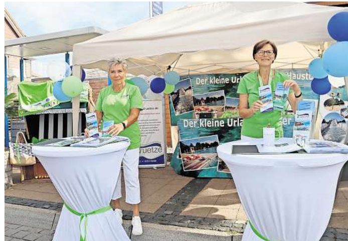
Das Naturbad-Team hält jede Menge Infos über das Uetzter Freibad bereit.