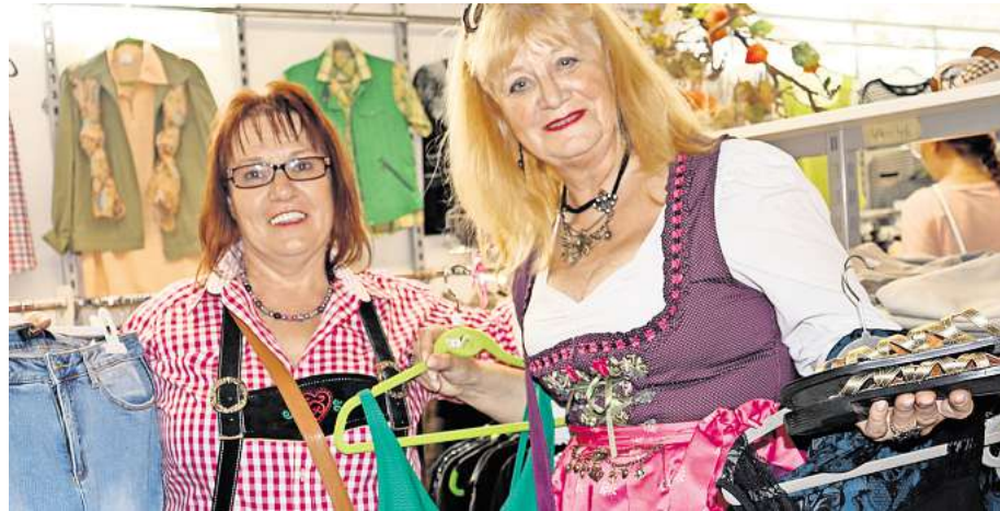
Kundinnen und Kunden finden bei „allerhand nUETZELiches“ eine große Auswahl ganz unterschiedlicher Kleidung.

Damit haben die Gäste die Gelegenheit, außerhalb der regulären Öffnungszeiten ganz in Ruhe in den Auslagen zu stöbern. Und das wird sich lohnen, denn die